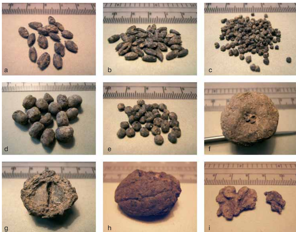
Fig. 5 - Settore AIII, frutti e semi: a) orzo; b) segale; c) miglio d) favino; e) lenticchia; f) pera; g) Pyrus/Malus ; h) noce; i) noce.

calce, che coprono uno strato di preparazione costituito da una battuta di terra argillosa mescolata a pietre. Tale pavimento appare tagliato da un'ampia ma poco profonda fossa di forma grossomodo ovale (fig. 6), che all'atto dello scavo era riempita da uno strato di terra scura mescolata a pietre, ricca di frammenti ceramici e vetri.