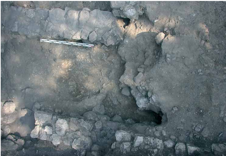
Fig. 4 - Settore AIII, fossa messa in luce presso il margine settentrionale.