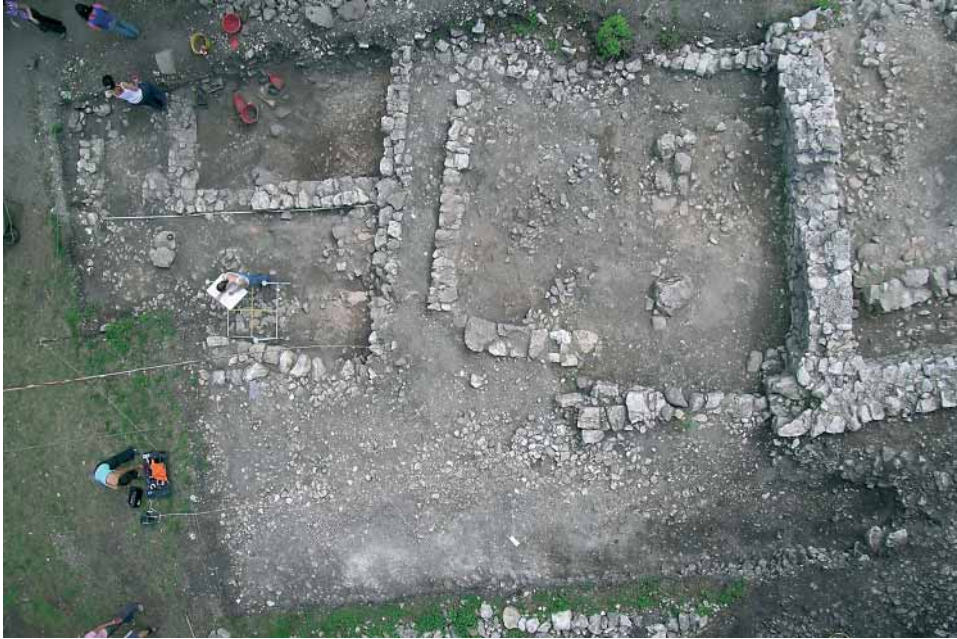
Fig. 3 - Panoramica del settore A III, in corso di scavo.