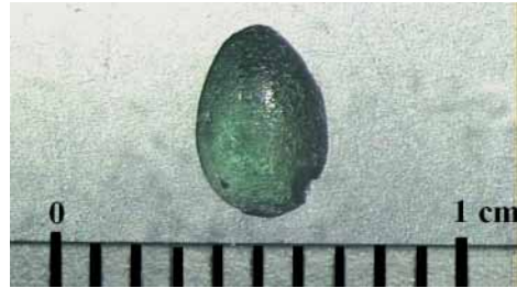
Fig. 18 - Settore A, gemma in pasta vitrea.