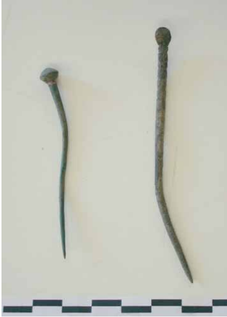
Fig. 16 - Settore A, spilloni in bronzo.