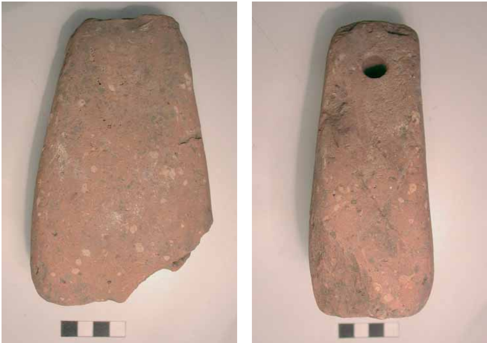
Fig. 15 - Settore A, peso da telaio in terracotta.