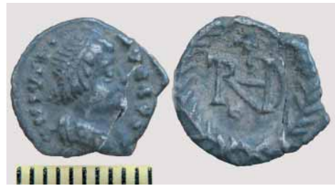
Fig. 20 - Settore B, frazione di siliqua d'argento.

Rimanendo nell'ambito degli oggetti d'ornamento, va segnalato il rinvenimento nel settore A di diversi granati almandini (fig. 19), che, come indica il rinvenimento di un esemplare ancora incluso nella matrice di micascisto, sono da ricollegare con tutta probabilità alla produzione di monili, analogamente a quanto attestato ad esempio nel castrum di Monte Barro in Lombardia (22) . Difficile stabilire con precisione la provenienza geografica di tali materiali: giaci-