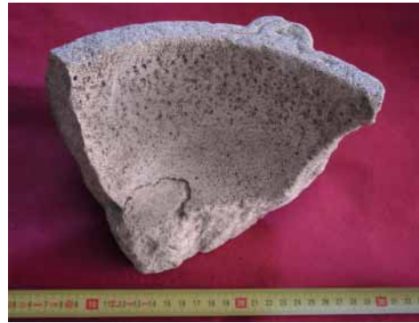
Fig. 13 - Settore A, mortaio in pietra.

eventuali tracce di decorazione ageminata sulla superficie. Il secondo reperto, che presenta una decorazione a cerchi oculati posizionati in prossimità dei quattro angoli, dove usualmente si trovano delle borchie (12), è anch'esso riconducibile a una cintura «a cinque pezzi», ma di bronzo. Il manufatto trova un calzante confronto in una guarnizione di cintura di VII secolo proveniente da S. Michele all'Adige (13) e in un esemplare rinvenuto all'interno una sepoltura