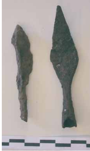
Fig. 10 - Settore A, punte di freccia in ferro.