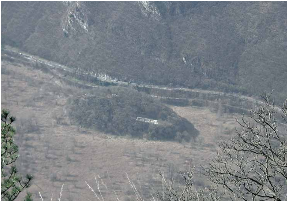
Fig. 2 - L'isola di S. Andrea, ripresa dal sito di S. Giustina.