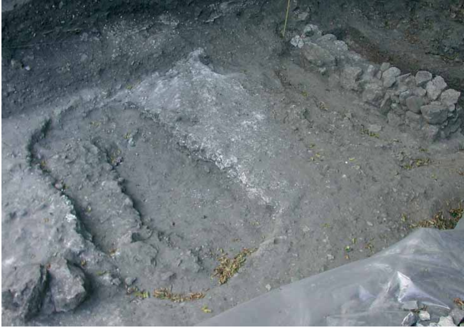
Fig. 6 - Settore AIV, da N: in primo piano la fossa ovale, a destra il muro.