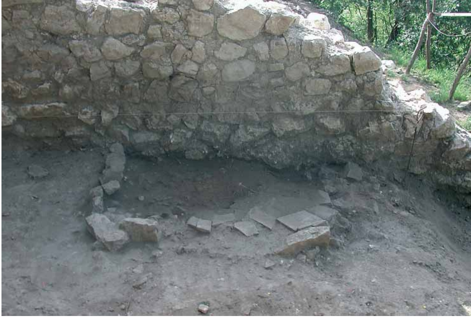
Fig. 7 - Focolare messo in luce nel settore B.