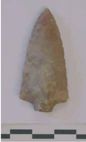
Fig. 9 - Settore A, cuspidi di freccia in selce.