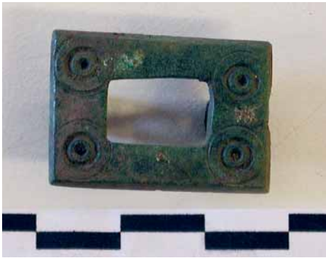
Fig. 12 - Settore A, placchetta di cintura in bronzo.