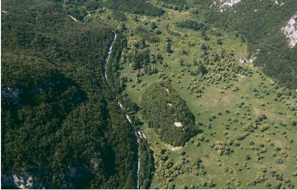
Fig. 1 - Panoramica del lago di Loppio con l'isola di S. Andrea.