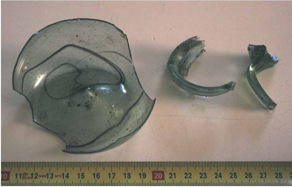
Fig. 14 - Settore A, frammenti di bottiglia in vetro.