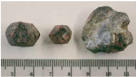
Fig. 19 - Settore A, granati.