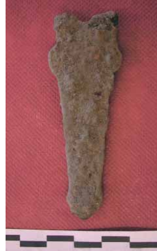
Fig. 11 - Settore A, placca di cintura in ferro.