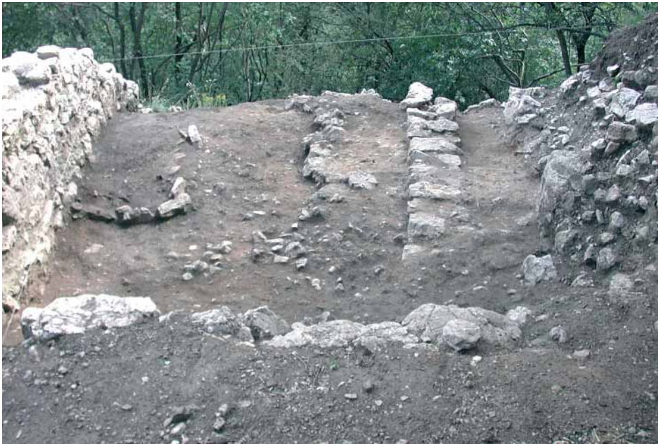
Fig. 8 - Settore B, panoramica dell'area settentrionale, da NE.