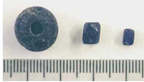
Fig. 17 - Settore A, vaghi di collana in pasta vitrea.